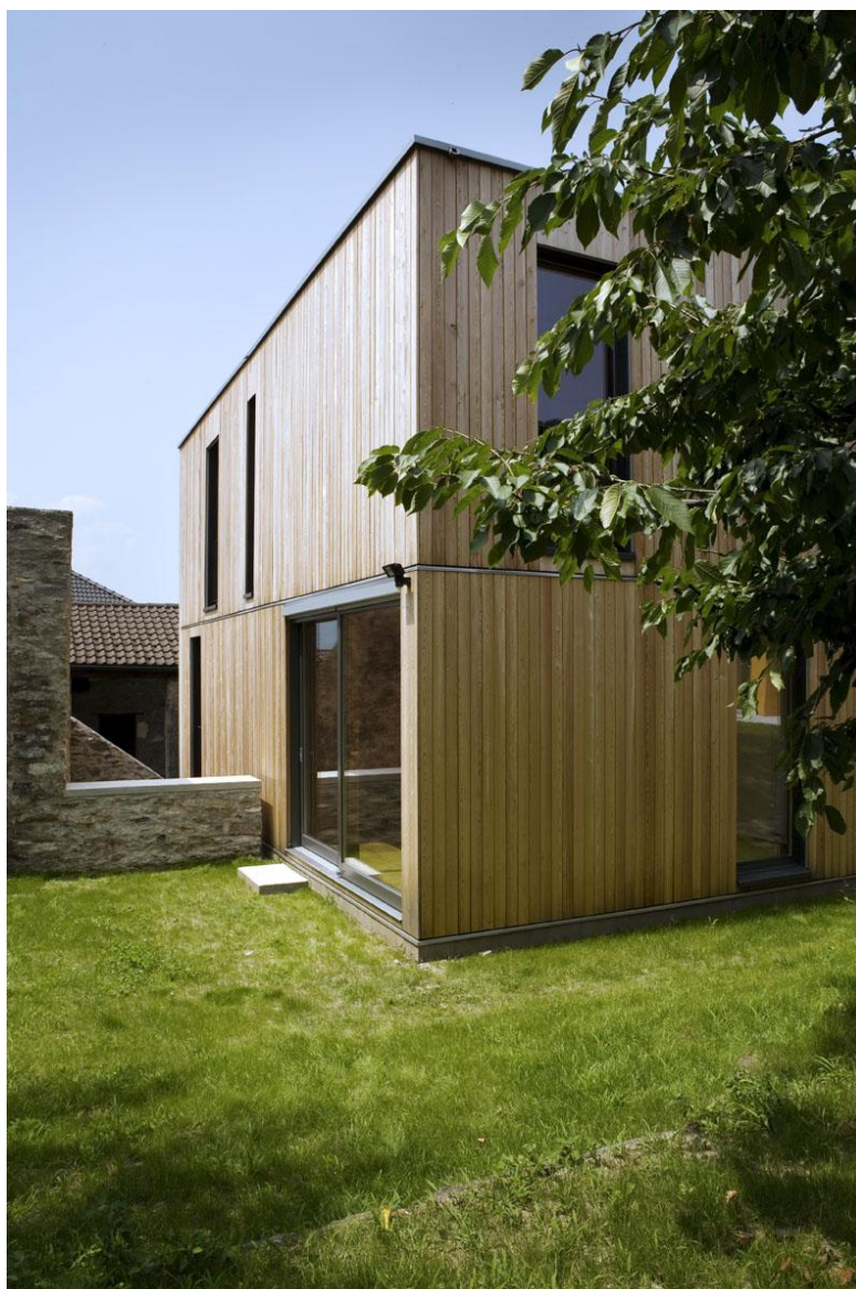
Canevascini & Corecco - abitazioni in piazzetta Fontana, Bellinzona-Ravecchia, 2005,'11