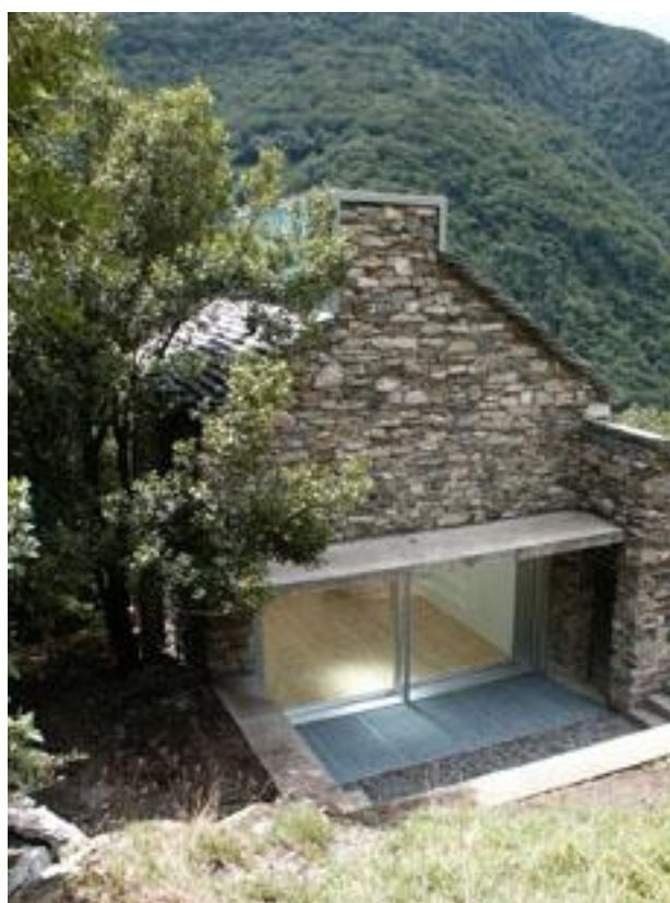
Casa e Atelier Bill - Michele Arnaboldi/Architetti di Locarno (CH)