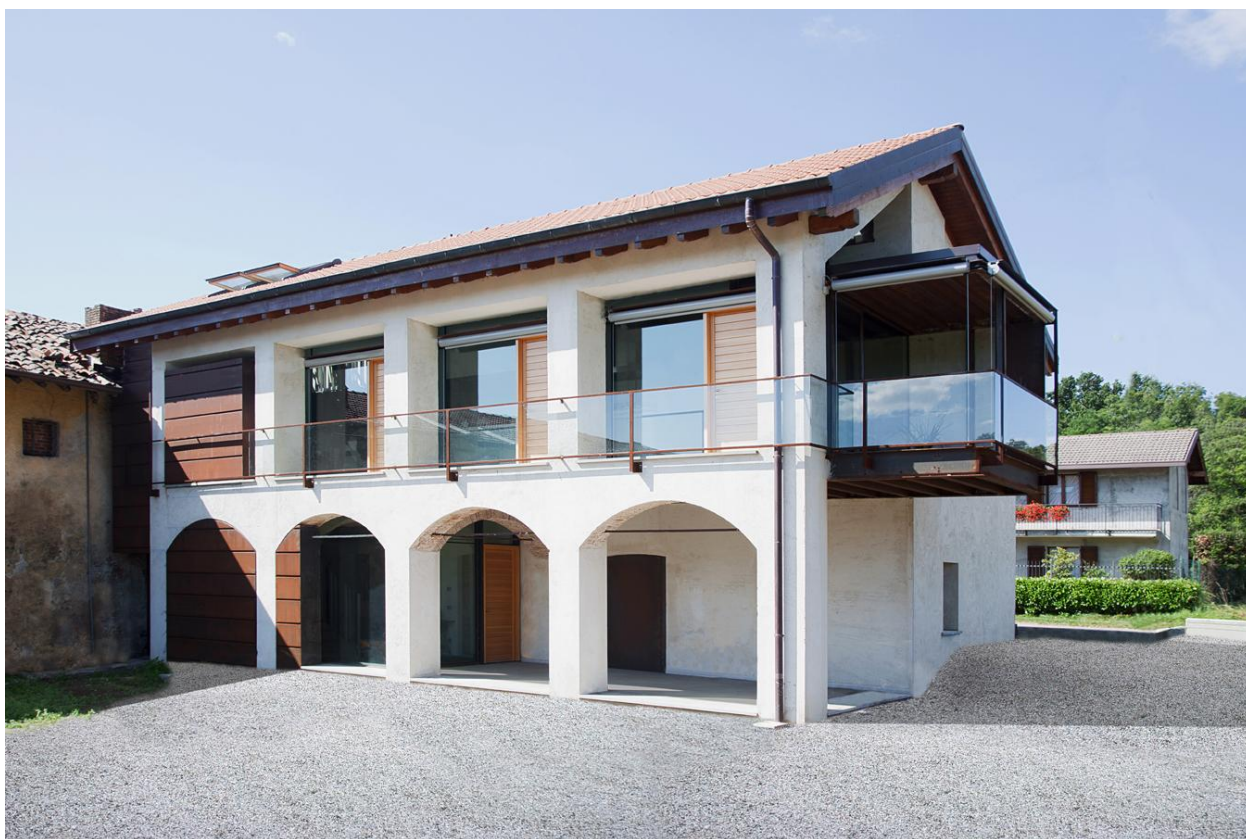
Pierfrancesco Secli - "recupero edilizio di un edificio rurale ubicato a Induno Olona"