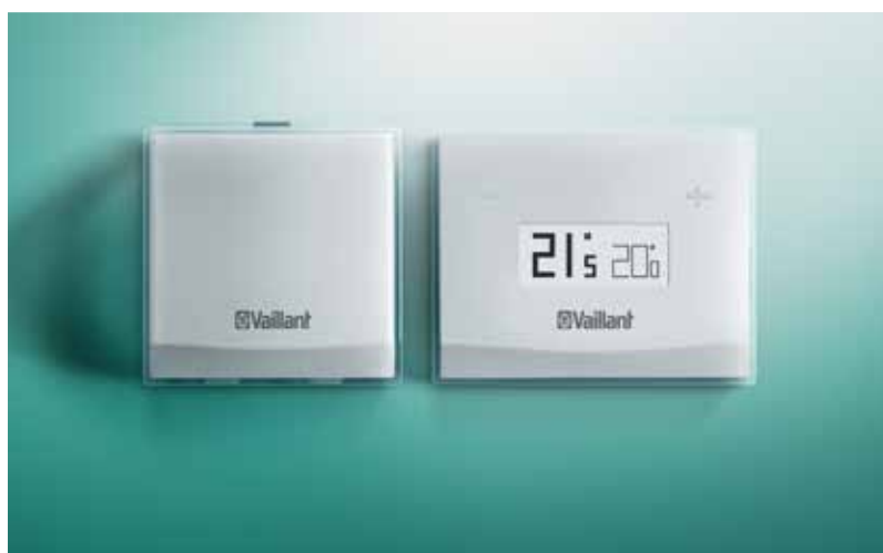
vSMART installata a parete e il suo dispositivo WiFi