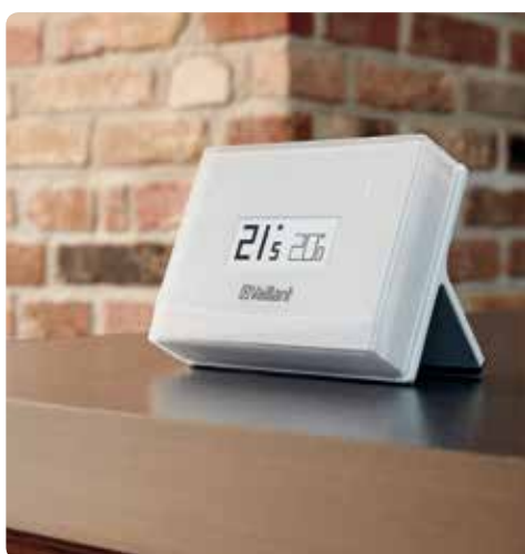
vSMART non installata a parete

vSMART trasforma il tuo smartphone o tablet in un sistema di controllo a distanza per il tuo riscaldamento. Ovunque tu sia e qualsiasi cosa tu stia facendo potrai controllare e regolare il comfort di casa in modo rapido ed estremamente intuitivo sfruttando la tua rete WiFi.