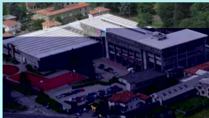
ITIS Via Stelvio Gallarate