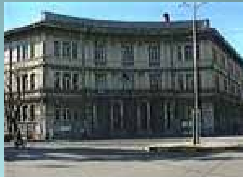
IPSIA Piazza Giovane Italia Gallarate