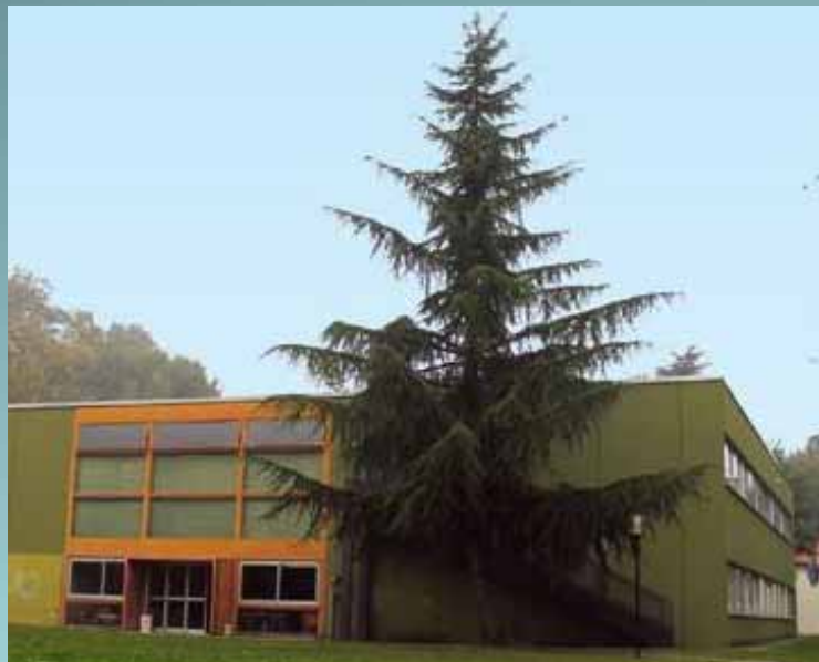
ITG Somma Lombardo